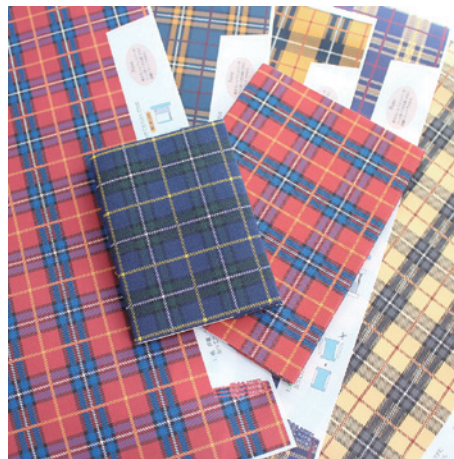
使用例（ブックカバー）