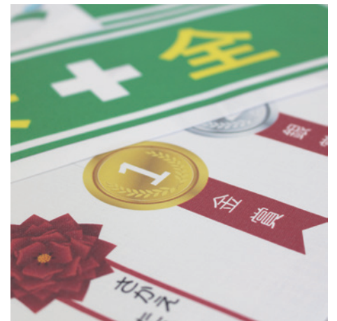
使用例（腕章・リボン記章）